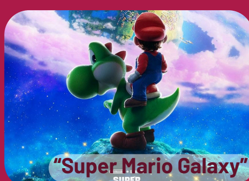
"Super Mario Galaxy"

Jeudi 9 juillet 19h30 - CASTELNAU- BARBARENS