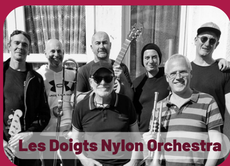
Les Doigts Nylon Orchestra

Jeudi 13 août 19h30 - MONTAUT- LES-CRENEAUX