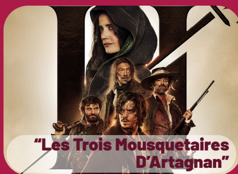
"Les Trois Mousquetaires D'Artagnan"

Jeudi 30 juillet 19h00 - CASTILLON- MASSAS