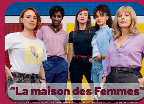
"La maison des Femmes"