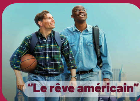
"Le rêve américain"

Jeudi 13 août 19h30 - MONTAUT- LES-CRENEAUX