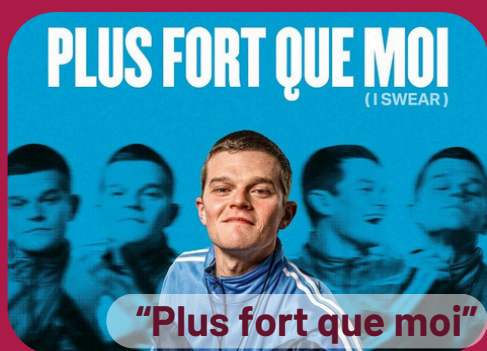
"Plus fort que moi"