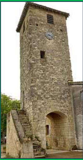
La porte-tour de Biran